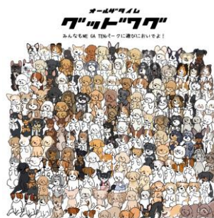
＜販売グッズイメージ＞