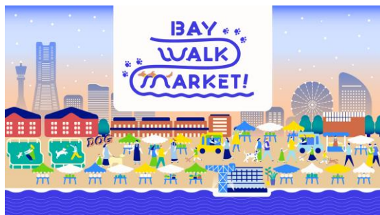
＜イベントキービジュアル＞

ワンちゃんと楽しいひと時を満喫！クラフトビールや様々なマーケットも展開 ＜ 2025 年 7 月 19 日（土）・20 日（日）・21 日（月・祝）＞